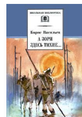
Васильев Б. «А зори здесь тихие»

Эта книга о тех, кто не вернулся с войны, о любви, о жизни, о юности, о бессмертии. В книге параллельно повествованию идёт фоторассказ. «Людей, которые на этих фотографиях, - пишет автор, - я не встречал на фронте и не знал. Их запечатлели фотокорреспонденты и, может быть, это все, что осталось от них».